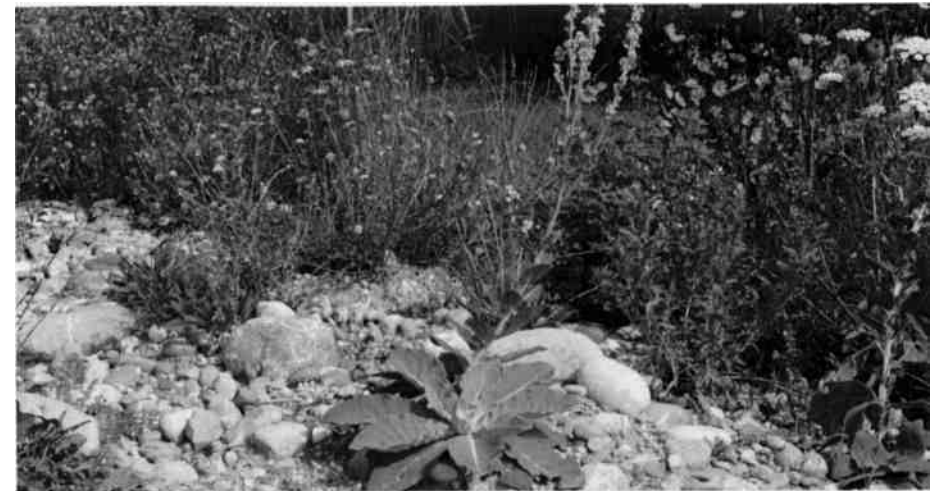
Blütenpracht einheimischer Pflanzen auf einer Ruderalfläche.

Mit diesen Spezialisten für die Erstbesiedlung beginnt die Sukzession, eine immer wieder ähnlich ablaufende Abfolge von Besiedlungsstadien, die im Reifestadium ihre Kulmination finden, in Mitteleuropa z. B. in einem alten Laubmischwald. Zwischenstadien sind u.a. eine Magerwiese oder die Vergandung (Verbuschung einer Fläche).