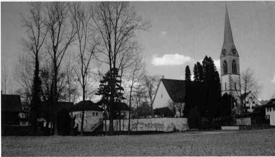
Ungestaltete Ruderalfläche aus den Bollensteinen, die unter der Drechslerei als Gesteinskoffer lagen. Der neue freie Blick vom See auf die reformierte Kirche Ende März 2007 ist beeindruckend. Die Kirchenmauer wird saniert.