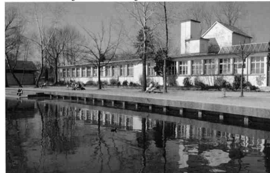
Die mehr als 100-jährige Drechslerei Bietenholz, Seequai Pfäffikon ZH, rückgebaut im Dezember 2006.

Die vom Gemeinderat daraufhin eingesetzte, gesellschaftlich breit abgestützte Arbeitsgruppe beleuchtete in einer Gesamtschau die Entwicklungsmöglichkeiten der gemeindeeigenen Freiflächen am See. Der Schlussbericht der Arbeitsgruppe Frei-/Ruderalfläche/Seequai, verabschiedet vom Gemeinderat am 13. Dezember 2005, bildet die Leitlinie für die angestrebte Entwicklung und hält u.a. fest: