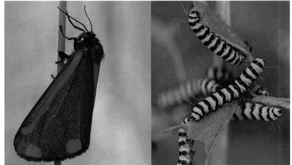
Blutbär ( Thyria jacobaeae ), Schmetterling und Raupen

Bewusst wird im Herbst nicht alles gemäht, damit Kleintiere, vor allem Heuschrecken und Spinnen, einen Teil ihrer Nahrungsgründe, Kinderstuben und Überwinterungsplätze behalten können. Die seltene Grosse Schiefkopfschrecke ( Ruspolia nitidula ), welche in jüngster Vergangenheit am Pfäffiker- und am Greifensee entdeckt wurde, profitiert von den ungemähten Streifen. Ihre langgestreckte schlanke Gestalt wird noch durch den nach vorne gerichteten Kopf und die über körperlangen Fühler betont.