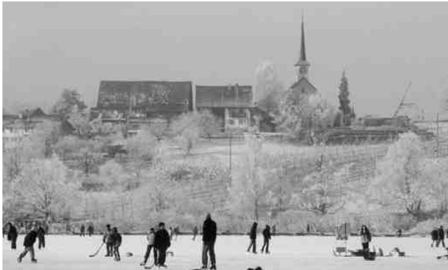
Vielfältige Erholung und Wintersport vor Seegräben