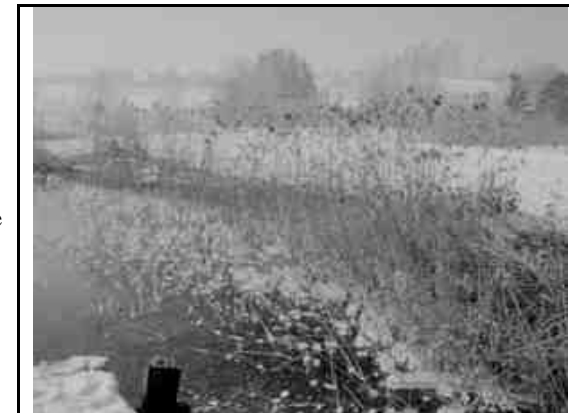
Massiver Schneefall hat im Februar 2003 fast den gesamten Schilfgürtel niedergedrückt. Er wird sich auch hier wieder erholen. Ein alter Schilfbestand ist für viele Wintergäste überlebenswichtig.

Ein zugefrorener See ähnelt einer Pauke. Die Unterschiede sind, dass die Pauke mit Luft gefüllt ist und der See mit Wasser, und dass die Pauken-Decke gespannt ist und die Eisfläche nicht. Die Form des Sees ist auch sehr viel flacher. Die Anregung geschieht bei der Pauke mit den Schlegeln, beim See mit den Schlittschuhen. Wenn man sich in einiger Entfernung von Dutzenden von Schlittschuhläufern (und vom Geschwätz) befindet, wird das Brummen hörbar. Die Eigenfrequenz beträgt beim Pfäffikersee ca. 1400\text{m} \cdot 18.5\text{m} / 2 = 37.8 Hz (d.h.