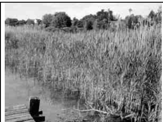
Bereits drei Monate später hat die Natur das geschundene Terrain zurückerobert. Ein dichter Schilfgürtel trennt den See vom Spazierweg.

Durch die Eisdecke wird der See von seiner wichtigsten Bewegungsenergie-