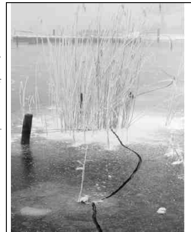
Einzelne Risse durchziehen das schwarze, glatte Eis auf geheimnisvolle Weise. Boden und Wasserpflanzen konnten wie durch eine Vitrine betrachtet werden.

Warmes Wasser ist leichter als kühles Wasser, d.h. es hat ein grösseres Volumen pro Masse. Bei etwa 4°C hat Wasser die grösste Dichte. Unterhalb dieser Temperatur nimmt die Dichte ab. Dichteres Wasser findet sich immer in der Tiefe. Im Sommer ist das Wasser in der Tiefe kälter, im Winter wärmer, als an der Oberfläche. Die exakte Temperatur des dichtesten Wassers wird durch den Druck (Wassertiefe und Luftdruck) und den Salzgehalt (hauptsächlich Calciumsalze) bestimmt. Sie beträgt für den Pfäffikersee 3.84°C. Wenn die Temperatur am Seegrund höher als 3.84°C ist, kann der See nicht zufrieren, da dieses Wasser leichter ist als das Wasser an der Oberfläche und aufsteigt. Bei einer weiteren