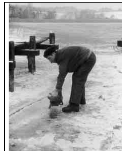
Mitglieder des Fischereivereins befreien die Stege vom Eisdruck.

In Abb. 2 ist der Sauerstoffgehalt in Isoplethenform dargestellt. Blau zeigt gute Sauerstoffwerte im Wasser an, grün bis gelb zeigen genügende und rot ungenügende Werte an. Der höchste Wert wurde im Mai mit mehr als 12\text{ mg/l} gemessen. Der in der Gewässerschutzverordnung geforderte Grenzwert beträgt 4\text{ mg/l} . In der Abbildung ist zu sehen, dass der Pfäffikersee ab Juni 2002 diesen Grenzwert nicht mehr erfüllte. Die Fische konnten von Mitte August bis Mitte Oktober in Tiefen unterhalb von 10 m nicht mehr atmen. Was aber nicht heissen muss, dass sich dort keine Fische aufhalten. Bei Schleien ist dieses Verhalten bekannt. Bei Felchen bestehen Anhaltspunkte, dass es so sein könnte. Bei Sauerstoffkonzentrationen von weniger als 1\text{ mg pro Liter} sind reduzierende Substanzen wie Methan und Ammonium und Schwefelwasserstoff zu erwarten. Das Sauerstoffdefizit wurde im Dezember bis an die Oberfläche hochgespült (weniger als 6\text{ mg/l} ) und der See belüftete sich rasch bis zur Seegröfmi, blieb dann eine Weile stecken und erholte sich fast ganz bis im März.