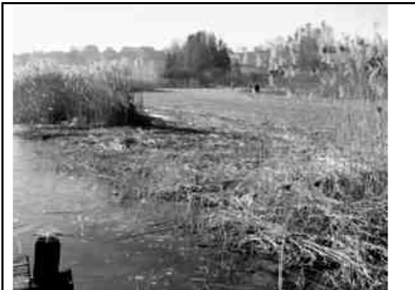
So präsentierte sich das Nordufer anfangs März 2002, nachdem hier Tausende von Besuchern den gefrorenen See über das teilweise abgemähte Schilf betreten hatten.

Kühlung entsteht eine stabile Schichtung, indem das kältere Wasser an der Oberfläche bleibt. Wie viel Kühlung nun noch notwendig ist, um die Oberfläche vollständig gefrieren zu lassen, ist eine Frage der Mischung: wenn nur der oberste Meter ausgekühlt 2) wird, was nur bei anhaltender Windstille möglich ist, braucht es nur wenige Tage. Bei Wind muss mehr Wasser abgekühlt werden, daher sind mehr Frosttage erforderlich. Die Unterschiede der Dichte des Wassers sind zwischen 3.84°C und 0°C recht klein (zirka 128g/m 3 ). Daher ist die nur ein Meter dicke Schicht die Ausnahme und das Auskühlen des ganzen Sees auf