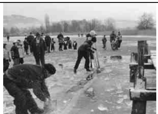
Mitglieder des Fischereivereins befreien die Stege vom Eisdruck.

Badestrand steigt die Temperatur höher. An den Dreiecken ist zu sehen, dass zwischen Dezember 2001 und März 2002 keine Probenahme erfolgte. Wie aus dem vorhergehenden Text zu entnehmen ist, muss die Temperatur in dieser Zeit in der grössten Tiefe auf unter 4^\circ\text{C} gesunken sein. An der Oberfläche, unter dem Eis, müssen es 0^\circ\text{C} gewesen sein. Im März war die Temperatur des ganzen Sees bereits wärmer als 4^\circ\text{C} . Diese