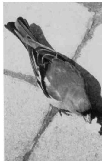
Buchfinkenmännchen (bei Peter Frei)

Gletschern der letzten Eiszeit eingewandert. Im Mai blühen zwischen dem weissflockigen Wollgras verschiedene Orchideen (etwa 15 Arten), Sumpfergissmeinnicht, Kuckuckslichtnelke, Klappertopf und Sumpfhornklee. Der Wegrand im Sommer leuchtet in allen Farben: Weiden-Alant (gelb), Kriechende Hauhechel (rosa), Blutweiderich (purpurrot) und Abbisskraut (hell blauviolett). Dazwischen finden wir die zartrosa Prachtnelke neben dem