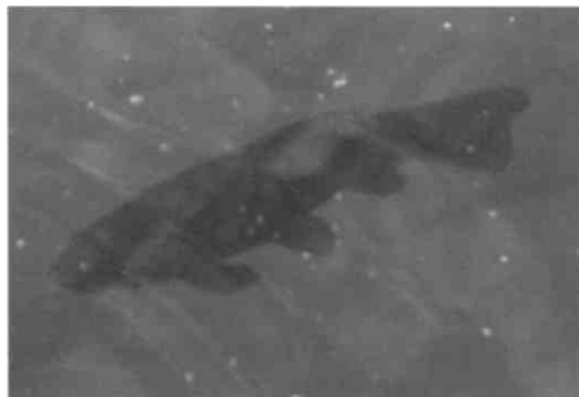
Eine Schleie. dunkle Färbung, rundliche Flossen

Die Sportfischer am Pfäffikersee (es gibt hier keine Berufsfischer mehr) heben den ausgezeichneten Felchen- und Hechtbestand hervor. Der Felchen, vor Jahrzehnten ausgestorben und Mitte Siebzigerjahre wieder ausgesetzt, muss allerdings in der Fischzuchtanlage vermehrt werden, eine Naturverlaichung existiert mangels geeigneter sandig-sauberer Laichplätze im Pfäffikersee nicht mehr. Auch dem Hechtbestand wird mit Zuchtmassnahmen nachgeholfen. Der Raubfisch lauert oft in kapitalen Exemplaren in den Seerosenbeständen, wo er neben kleineren Fischen auch schwimmende Jungvögel erbeutet. Ein schöner und eleganter Geselle ist der Egli, in seiner Grossform ab 30 cm auch Relig genannt. Ab und zu lassen sich ganze Schwärme dieses senkrecht schwarz gestreiften Fisches sehen. Karpfen und Schleien halten sich gerne in der Tiefe der Uferregion auf. Letztere erkennt man an ihrer dunklen, grün-goldenen Färbung, der orangen