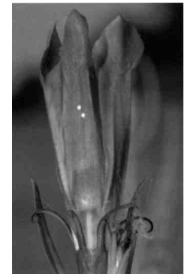
Lungenzian mit Eiern des Moorbläuling

In jüngerer Zeit wurde auch das Vorkommen der Muscheln genauer erforscht. Als einzige Grossmuscheln konnten sich die Gemeinen Teichmuscheln einigermaßen halten. Tage- oder