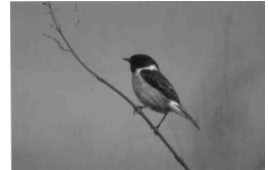
Das Schwarzkehlchen: Brütet es hier bald regelmässig?