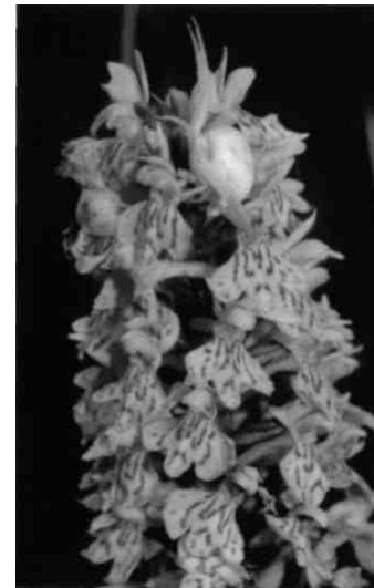
Krabbenspinne auf einer Orchis

Mundpartie und den auffallend rundlichen Flossen. Aus Gründen, die von Fach-