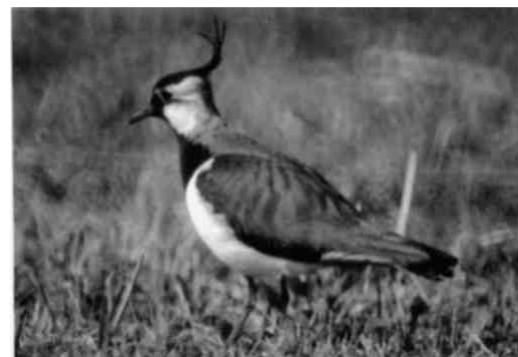
Der Kiebitz kommt früh im Jahr aus dem Mittelmeerraum zurück

Von allen Tieren am Pfäffikersee werden die Vögel am regelmässigsten und genauesten erforscht, gezählt und kartiert. Die Daten kommen von verschiedenen Beobachtern und Beobachterinnen um den See zusammen und gelangen schliesslich über Walter Hunkeler (Wetzikon) an die Vogelwarte Sempach. Der Pfäffikersee ist für die Ornithologen ein Mekka, sie kommen weither gepilgert und kehren nach unvergesslichen Erlebnissen wieder heim. Wenn im März die Kiebitze ihre tollkühnen Balzspiele zeigen, lautstark begleitet durch ein klagendes «Kieh-witt», fällt das auch Laien auf. Sie staunen über die Zutraulichkeit und Schönheit der Allerweltsvögel Buchfink und Kohlmeise im Strandbad Auslikon, welche sich auf der Hand füttern lassen. Drei Viertel