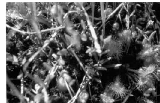
Moosbeere und Sonnentau

Hier wächst der Rundblättrige Sonnentau zwischen dem Geflecht der Moosbeere, welche im Herbst