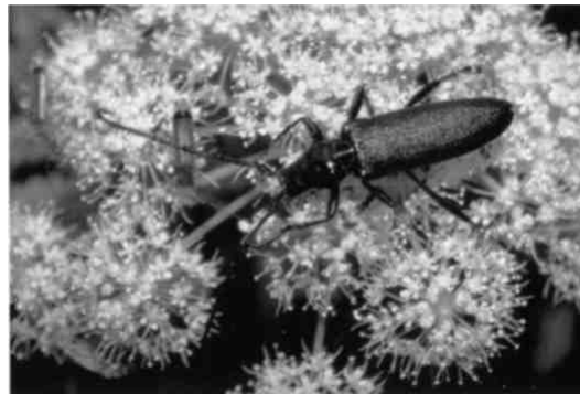
Mochusbock mit Weichkäfern

Vor nicht allzu langer Zeit wurde in Robenhausen ein Wiedereinbürgerungsversuch für den Weissstorch unternommen. Leider konnte der stattliche Vogel nicht gehalten werden, er flog im Beisein