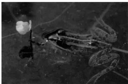
Wasserfrosch, Wasserschlauch (vemtul. australis)

dunkelrotvioletten Fettblatt und dem fein geäderten, zierlichen weissen Studentenröschen. Wilde Rüebli, Mädessüss, Baldrian und Sumpfwurz bilden die Hochstaudenfluren, oft in Gesellschaft der weniger geschätzten Kanadischen Goldrute. Von hoher Warte ertönt der gleichmässige Gesang des Grünen Heupferdes. An warmen Tagen summen zahlreiche Bienen, Hummeln, Wespen, Fliegen und Käfer von Blüte zu Blüte, Schmetterlinge gaukeln über die Wiese. Die meisten der 50 festgestellten Tagfalterarten leben vom Blütenreichtum der mageren Feucht- und Trockenwiesen des Gebiets, unter ihnen Raritäten wie Skabiosenscheckenfalter, Braunfleckiger Perlmutterfalter und Kleiner Moorbläuling. Für seine Entwicklung braucht letzterer einerseits einen guten Bestand von Lungenenzian, andererseits das