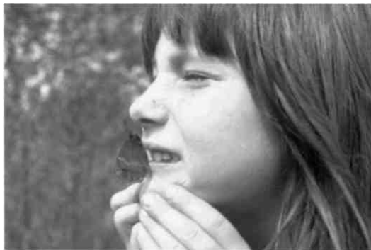
Sich von der Natur berühren lassen! Blauauge auf ungewohntem Landeplatz!

meinde eine Trockenmauer mit vielen Nischen für Kleintiere gebaut. Grossflächige Buntbrachen mit Mohn, Kornblumen und Kornraden erblühen unweit des Kastells. Auf solchen Trittsteinen leben Restpopulationen der Zauneidechse und des Schachbrettfalters, Zugvögel finden einen reich gedeckten Tisch.