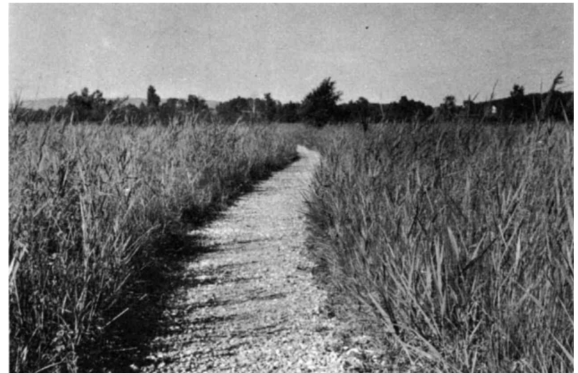
Der gleiche Weg im ausgebauten Abschnitt. Die Ordnung in der Landschaft wirkt sich auf das Verhalten des Besuchers aus.