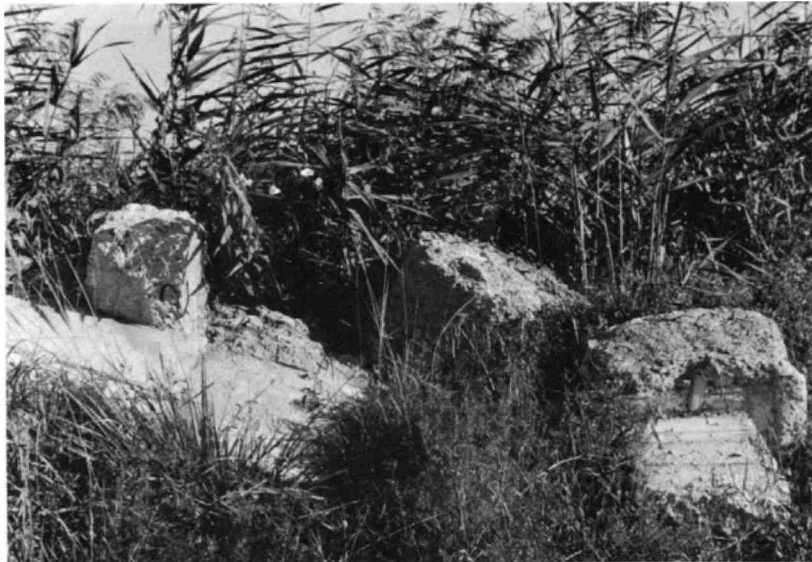
Ablagerungen jeglicher Art verschandeln die Landschaft und zerstören den Schilfbestand.

weist einen guten Bestand auf und die Überwachung des Schutzgebietes erweist sich als unbedingtes Erfordernis. Das zeigten die verschiedenen Verzeigungen, die auch im letzten Jahr nebst unzähligen Belehrungen notwendig waren. Es ist vorgesehen, die Aufsicht über das Schutzgebiet nach verschiedenen Richtungen noch besser zu organisieren. Dies ist vor allem hinsichtlich der schweren Eingriffe in diese Naturlandschaft, die immer wieder festgestellt werden müssen, not-