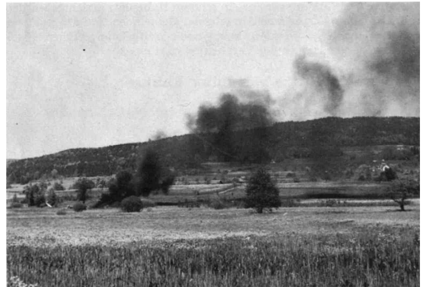
Dieser Brandplatz konnte nach längeren Bemühungen verlegt werden.

Als ein wesentlicher Erfolg darf die Verlegung des Brandplatzes der Firma AG R. & E. Huber, Pfäffikon, gewertet werden. Durch das Entgegenkommen der Gemeinde war es möglich, vorläufig einen andern Platz ausfindig zu machen. Sobald eine endgültige Lösung gefunden ist, wird das bisherige Areal wieder der Umgebung angepasst. Der Firma AG Huber und der Gemeinde Pfäffikon gebührt für die Bemühungen der beste Dank.