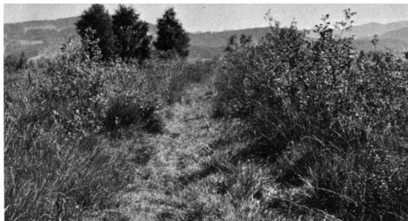
Werden die Riedparzellen nicht mehr gemäht, so verholzen sie im Laufe der Zeit unweigerlich.

muss der Fichtenhag nördlich der Ferienhäuser beim Strandbad «Baumen» bezeichnet werden. Dieser ist vor ca. 35 Jahren gepflanzt worden und hat eine ansehnliche Höhe und Dichte erreicht. Als gradlinige Formation im freien Gelände wirkt der Hag landschaftsfremd und hemmt die freie Sicht auf den Schilfsaum und das Ufer. Diese Angelegenheit wurde mit den Grundeigentümern eingehend beraten. Eine im Jahre 1944 erteilte Konzession der Baudirektion zur Erstellung von Bootsstegen bei diesen Liegenschaften ist abgelaufen und muss erneuert werden. Wenn durch eine bessere lockere Bepflanzung an der oberen Grenze der Liegenschaften eine schönere landschaftliche Gestaltung mit freien Durchblicken auf den See ermöglicht wird, so könnten die Bootsstege als privates Privileg weiterhin im öffentlichen Seegebiet toleriert und evtl. der Schilfgürtel längs dieser Liegenschaften abgesperrt werden. Dies würde auch im Interesse des Vogelschutzes liegen.