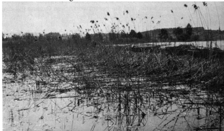
Monatelanger hoher Wasserstand schädigt den Schilfbestand und macht die Wanderwege unpassierbar.