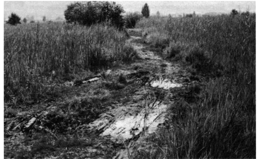
Der nicht ausgebaute Moorweg wird immer breiter, die Riedvegetation wird zerstört.